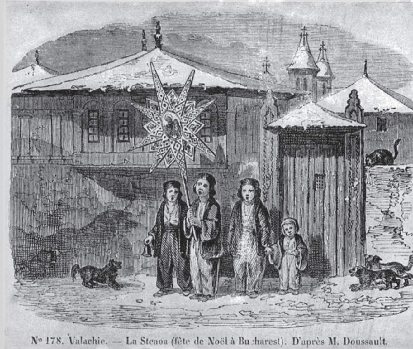
Nº 178. Valachie. — La Steaoa (fête de Noël à Bucharest). D'après M. Doussault.

Pe teritoriul românesc, Crăciunul este una dintre cele mai importante sărbători creștine.