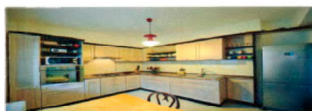
SC MOBLACOST DESIGN SRL ȘAG. STR. CXI NR.30

Executa la comanda : - Mobilier din lemn, furnir si Pal Melaminat - Uși de interior si scări din lemn - Garduri, pergole, mobilier de gradina - Diverse lucrări de tamplarie