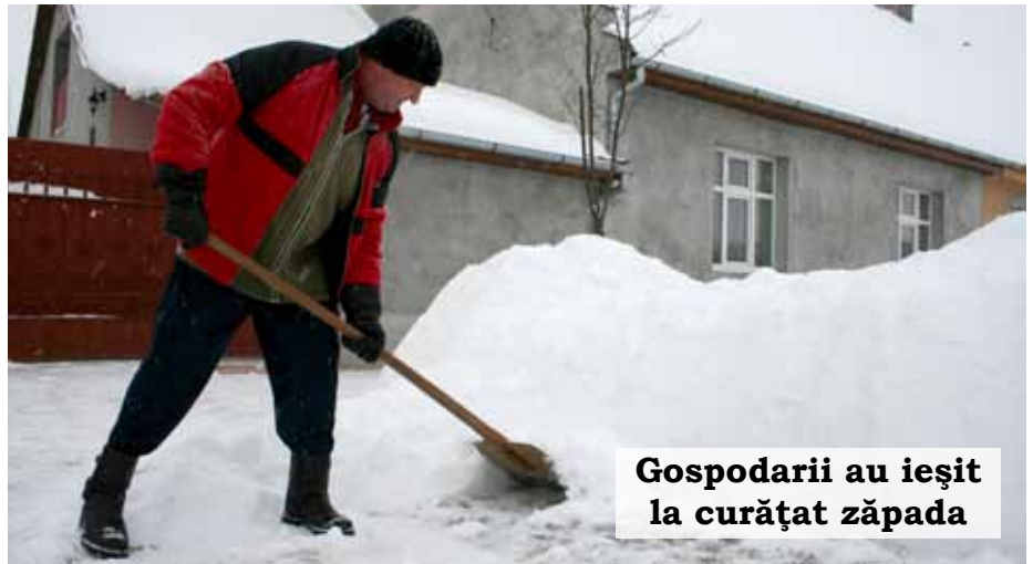
Gospodarii au ieșit la curățat zăpada

fost criticat că îmi fac campanie electorală dezvăpezind comuna. Reamintesc tuturor că primarul este șeful comandamentului de urgență și atunci când este cod galben, cum a fost în luna februarie, am obligația legală să asigur permanența la primărie și să asigur coordonarea operațiunilor necesare. Mă așteptam ca și consilierii locali să participe, mai ales că unii au și utilaje, dar asta nu s-a întâmplat”, și-a explicat poziția primarul Venus Oprea.