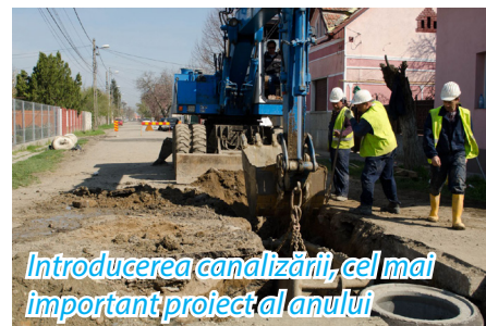
Introducerea canalizării, cel mai important proiect al anului

Pentru Zona Mănăstire, am pregătit un proiect de extindere a rețelei de iluminat stradal pe drumul spre Mă-