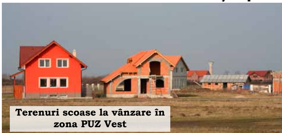
Terenuri scoase la vânzare în zona PUZ Vest

PRIMĂRIA a decis să scoată la licitație 19 parcele de teren în cartierul PUZ Vest. Acestea au suprafețe între 645 și 1085 mp. La prima licitație din data de 17 iunie au fost adjudecate 3 terenuri, dar Primăria va organiza licitații în fiecare săptămână, până la epuizarea parcelor.